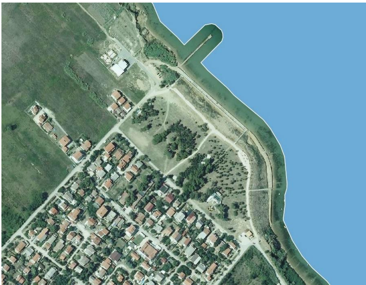
POLOŽAJ ZONE REKREACIJSKE NAMJENE „SABUNIKE-ŠUMICA“